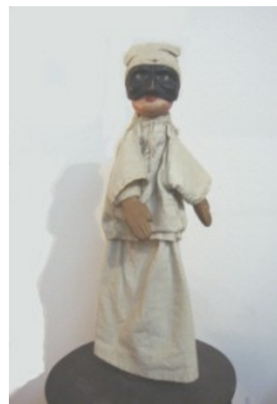
Primera marioneta hecha por Bruno Leone

El equipo de rodaje ira a Vietnam dentro de pocos días a fin de constatar la evolución de esta forma única que constituyen las marionetas sobre agua. Iremos, entre otros lugares, en los pequeños pueblos de Nguyen Xa y Nam Chan (delta del rio rojo) donde la transmisión parece ser fragilizada.